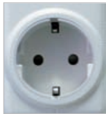
RFRP- 20/S: Schuko