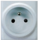
RFRP- 20/F: French