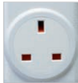
RFRP- 20/B: British