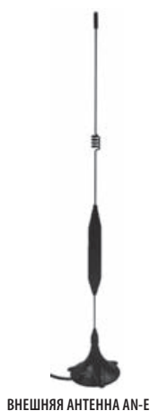
ВНЕШНЯЯ АНТЕННА AN-E