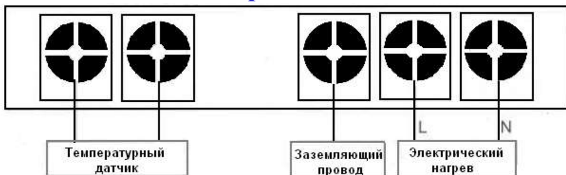
Схема электрических соединений

Прибор отличается стильным внешним видом благодаря черной блестящей верхней крышке. Контроллер имеет высокое качество и обеспечивает стабильные рабочие характеристики.